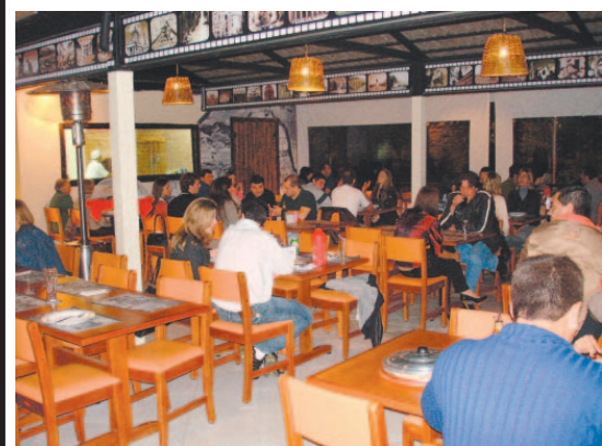
O amplo, requintado e aconchegante ambiente.