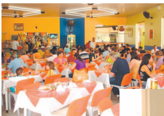
...o amplo e aconchegante ambiente da Casa.