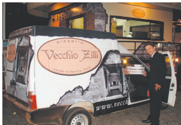
O serviço de Disk Entrega Vecchio Zilli. Disk: (19) 3817.2161/3817.2156.

Especialidade da casa "Caprese": molho de tomates, mussarela ao forno coberta com tomate caqui, fatias de mussarela de búfala artesanal, folhas de manjerição pesto de azeitonas pretas e orégano.